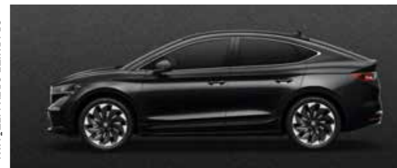
MAGIC BLACK METĀLIKA