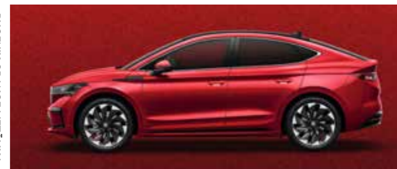
VELVET RED METĀLIKA