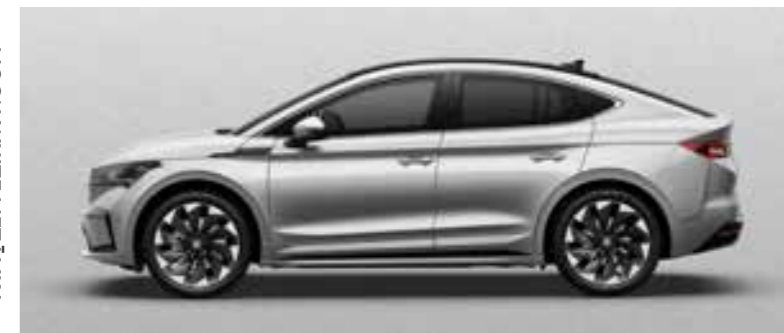
BRILLIANT SILVER METĀLIKA