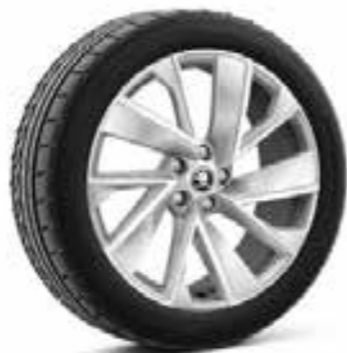
20" VEGA sudraba metālikas vieglmetāla diski