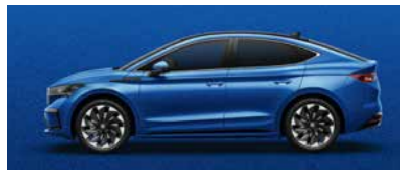
RACE BLUE METĀLIKA