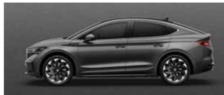
GRAPHITE GREY METĀLIKA