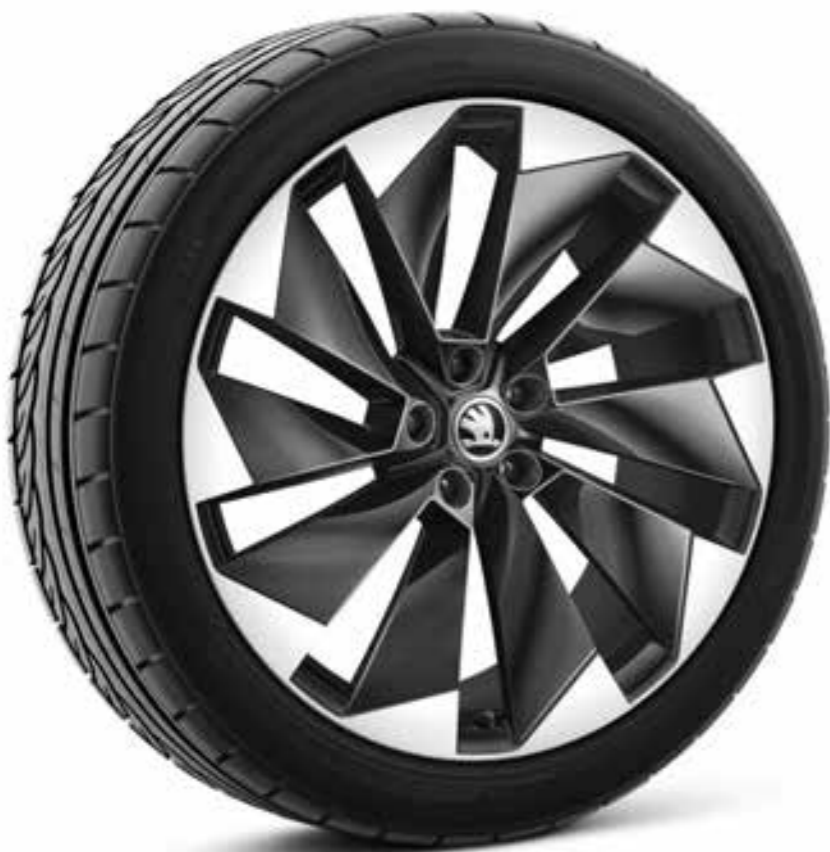
21" SUPERNOVA antracīta metālikas vieglmetāla diski