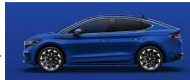
ENERGY BLUE UNI