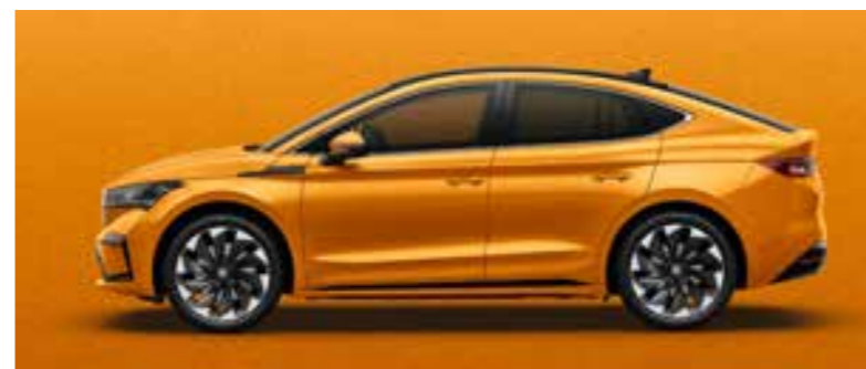
PHOENIX ORANGE METĀLIKA