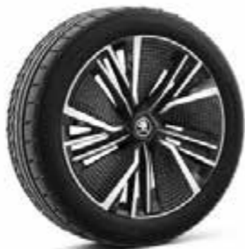
20" NEPTUNE antracīta vieglmetāla diski ar Aero uzlikām