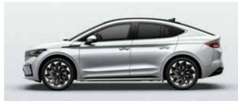
MOON WHITE METĀLIKA