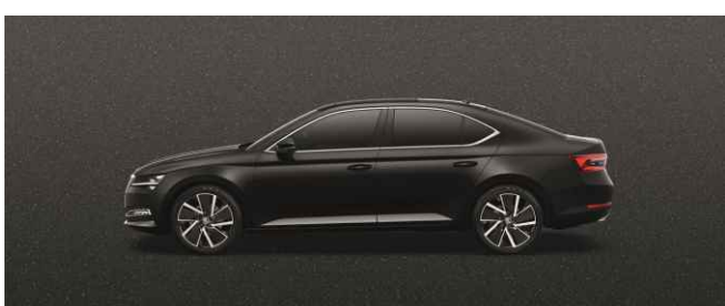
BLACK MAGIC METĀLISKA