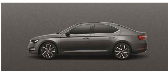
GRAPHITE GREY METĀLISKA