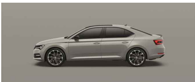
STEEL GREY METĀLISKA