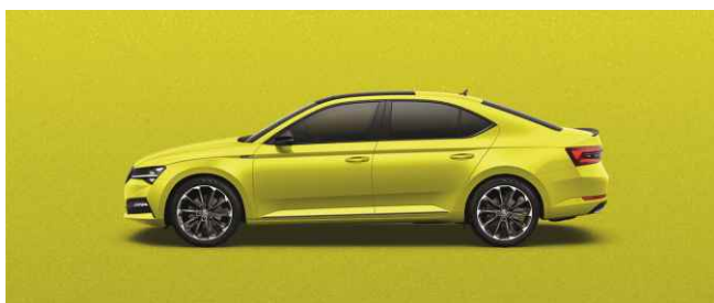
DRAGON SKIN METĀLISKA (Sportline)