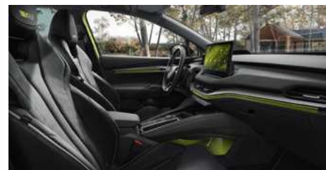
DIZAINA PAKETE "RS SUITE"