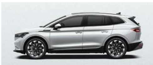
MOON WHITE METĀLISKA KRĀSA 730 €