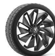
21" SUPERNOVA antracīta metālika 1 580 €