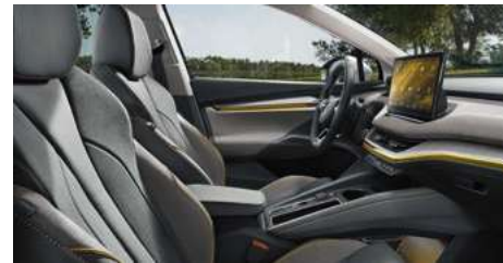
DIZAINA PAKETE "LOUNGE"