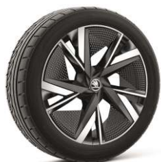
20" TAURUS 810 €