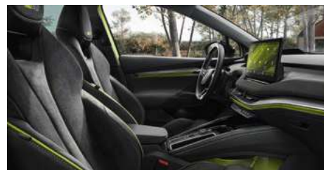
DIZAINA PAKETE "RS LOUNGE"