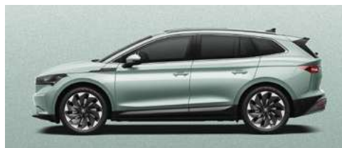
ARCTIC SILVER METĀLISKA KRĀSA 730 €