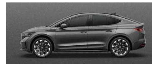
GRAPHITE GREY METĀLISKA KRĀSA 730 €