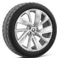
20" VEGA sudraba metālika 710€