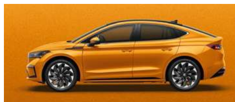
PHOENIX ORANGE METĀLISKA KRĀSA 730 €