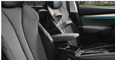
DIZAINA PAKETE "LOFT"