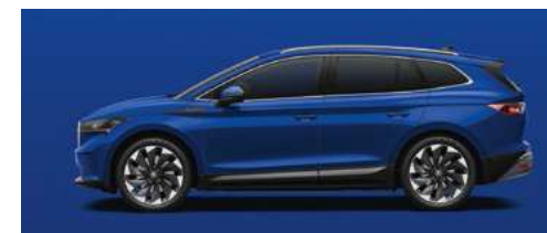
ENERGY-BLUE STANDARTA KRĀSA 0 €