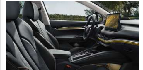
DIZAINA PAKETE "SUITE BLACK"