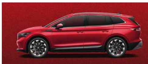
VELVET RED SPECIĀLĀ KRĀSA 1 200 €