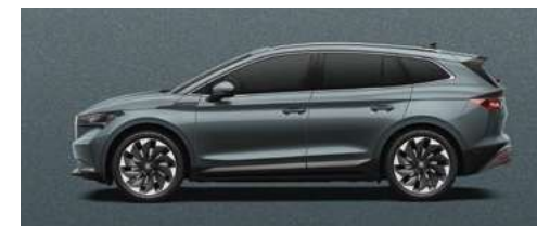
GRAPHITE GREY METĀLISKA KRĀSA 730 €