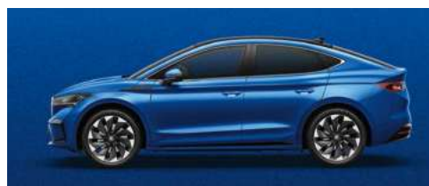
RACE BLUE METĀLISKA KRĀSA 730 €