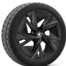
20" TAURUS BLACK AERO disku uzlikas