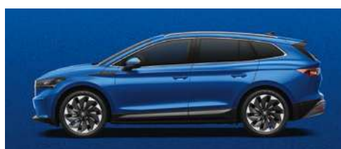
RACE BLUE METĀLISKA KRĀSA 730 €