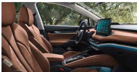
DIZAINA PAKETE "ECO SUITE"