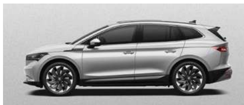
BRILLIANT SILVER METĀLISKA KRĀSA 730 €