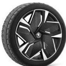
21" VISION AERO disku uzlikas 770 €