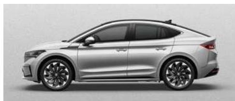
BRILLIANT SILVER METĀLISKA KRĀSA 730 €