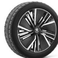
20" NEPTUNE AERO disku uzlikas 920 €