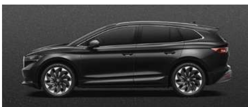
BLACK MAGIC PEARLESCENT METĀLISKA KRĀSA 730 €