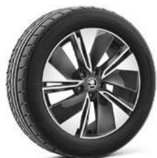
19" REGULUS antracīta metālika 210 €