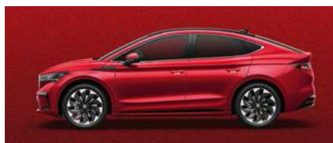
VELVET RED SPECIĀLĀ KRĀSA 1 200 €