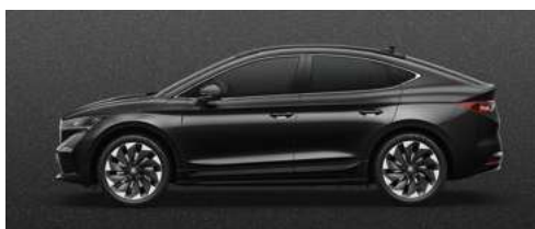
BLACK MAGIC PEARLESCENT METĀLISKA KRĀSA 730 €