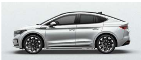
MOON WHITE METĀLISKA KRĀSA 730 €