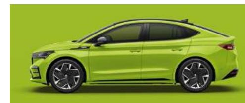
MAMBA GREEN STANDARTA KRĀSA 470 € (tikai RS)