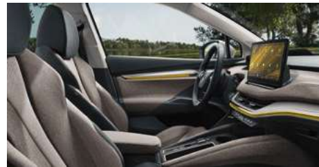
DIZAINA PAKETE "LODGE"