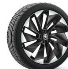
21" SUPERNOVA melna metālika 1 580 €