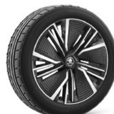
20" NEPTUNE 810€