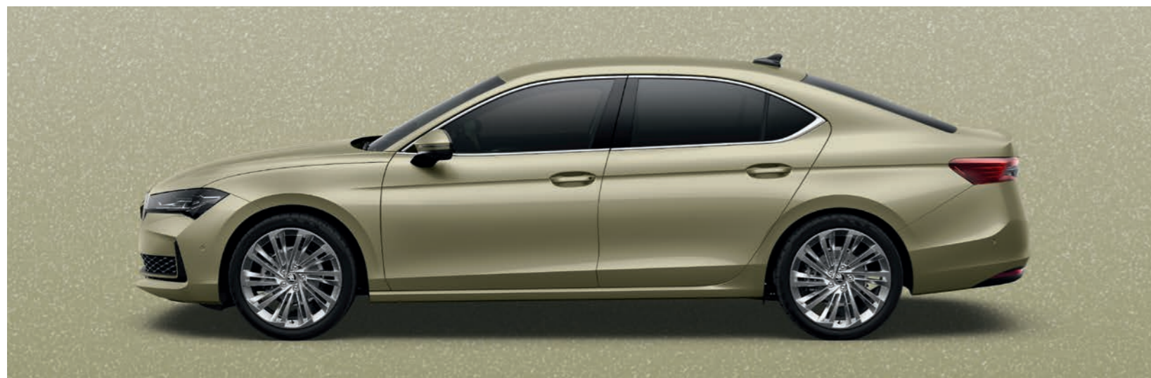
Ice Tea Yellow metālika