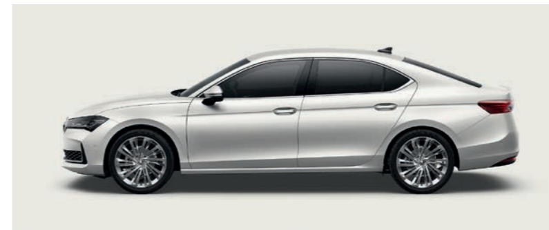
Purity White nemetālika