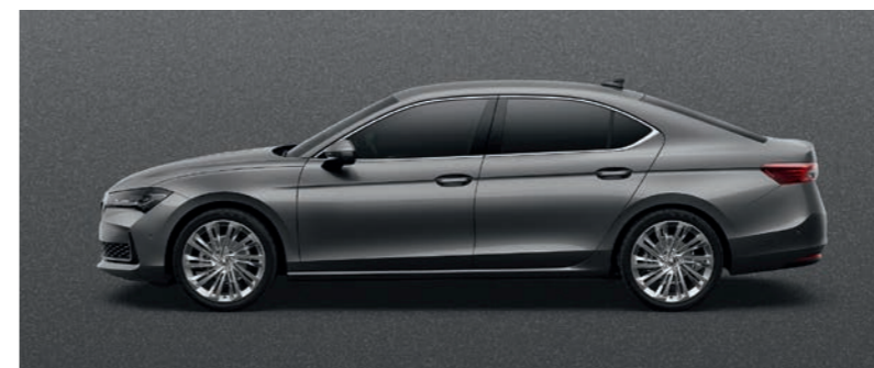
Graphite Grey metālika