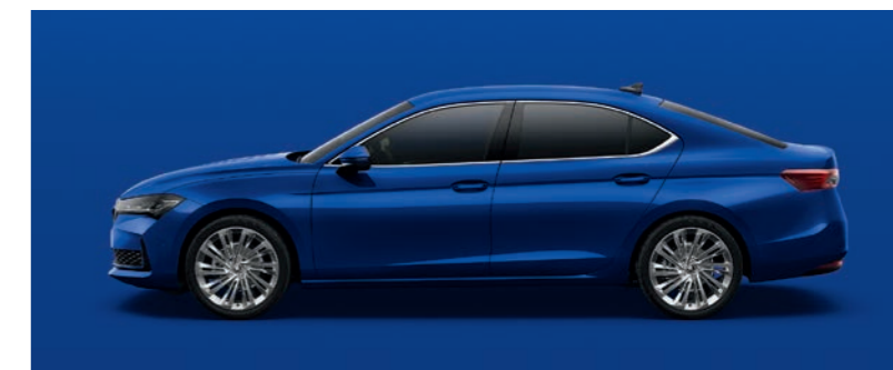
Energy Blue nemetālika