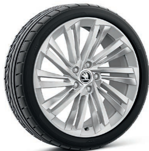
19" Veritate sudraba krāsas vieglmetāla diski