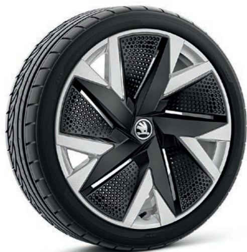
19" Aniara sudraba krāsas vieglmetāla diski ar melnām aero uzlikām