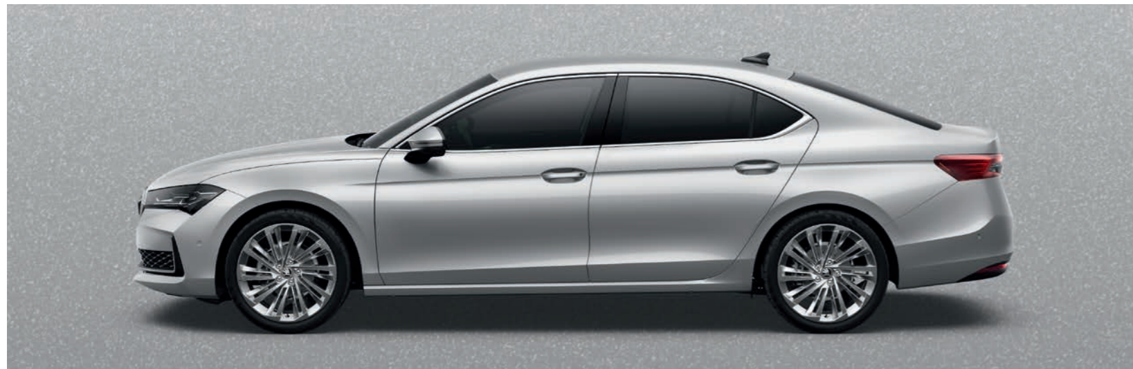
Pebble Silver metālika