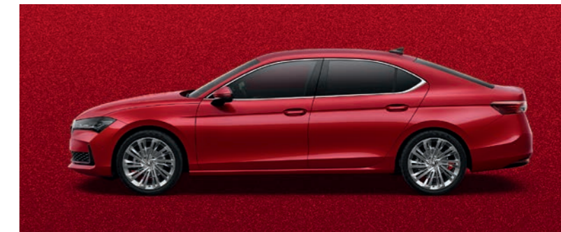
Carmine Red metālika