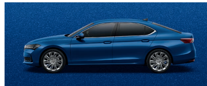
Cobalt Blue metālika