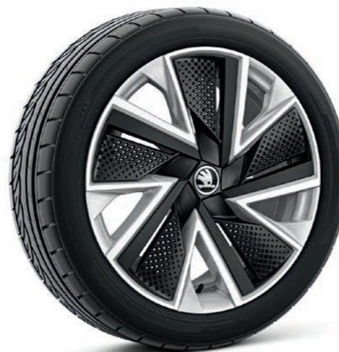
18" Bosona sudraba krāsas vieglmetāla diski ar melnām aero uzlikām