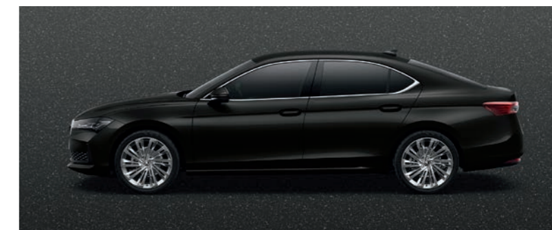
Ebony Black metālika