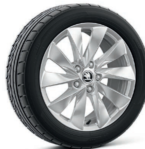
17" Mintaka sudraba krāsas vieglmetāla diski