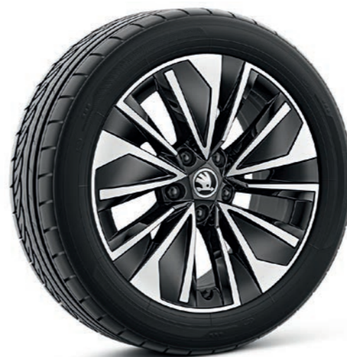
17" Alrakis melni / sudraba krāsas vieglmetāla diski